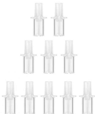
10 Pieces Mouthpiece