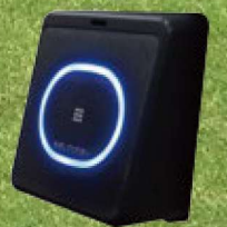
ワイヤレス通信対応